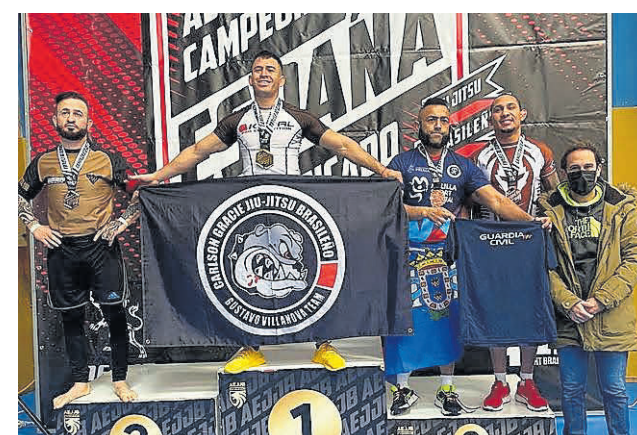
El concejal de Deportes durante la entrega de trofeos. / L. T.